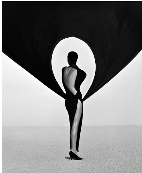
> Herb Ritts, Versace Dress Back View, 1990