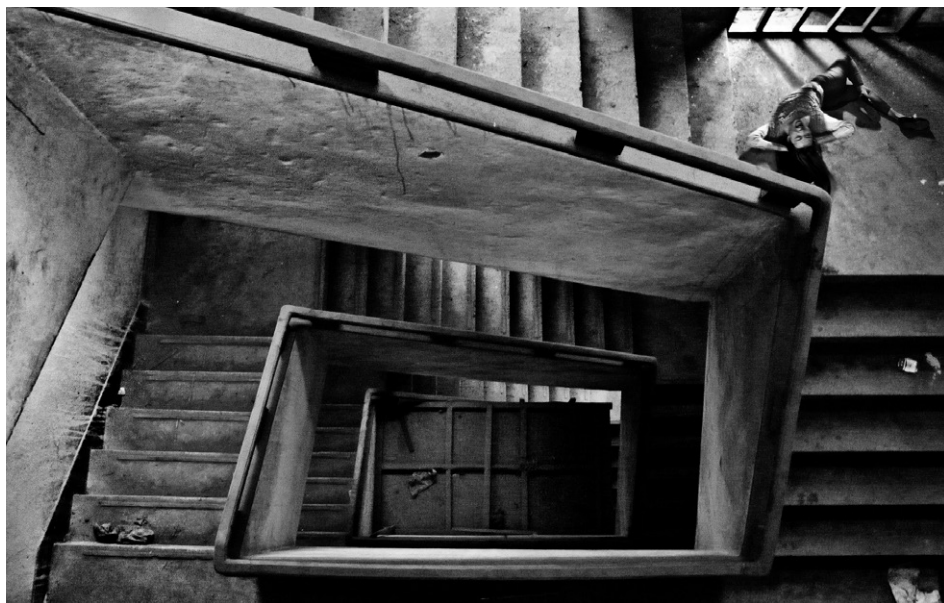
> Yu Likwai, Bad Seed, 2013