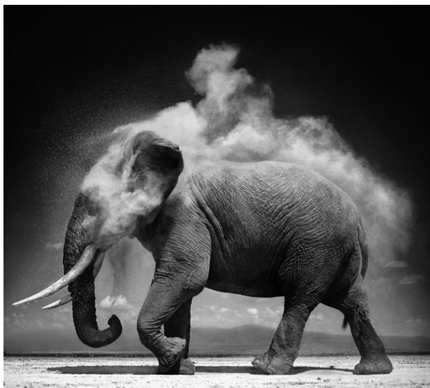
> Nick Brandt, Elephant with Exploding Dust, Amboseli 2004